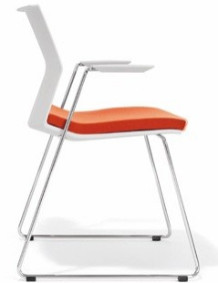
Design von B4K, Andreas Krob

Fertigungsverfahren: Kunststoff Spritzguss, Blechbiegeteile, Schweißbaugruppen